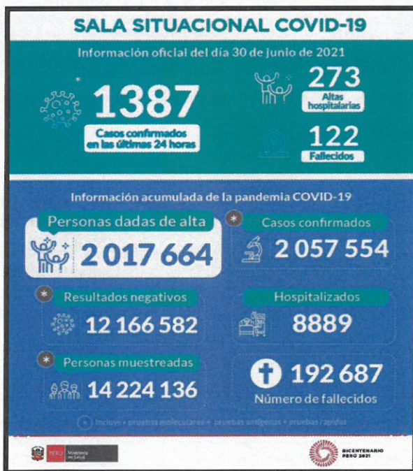
Imagen N° 01: Sala Situacional COVID-19 en el Perú, al 30 de junio de 2021.

De acuerdo a la Sala Situacional COVID-19 del MINSA, al día 30 de junio de 2021, el Perú presenta 2,057,554 casos positivos de 14,224,136 muestras y 192,687 fallecidos (ver imagen N° 01).