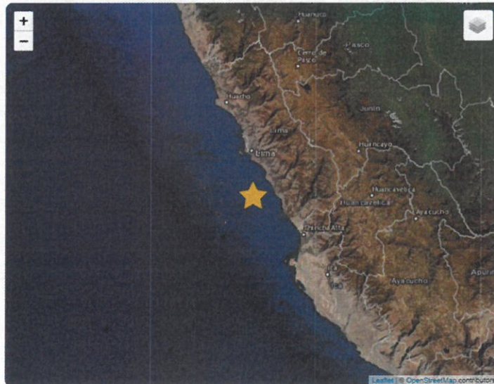
Imagen N° 02: Sismo de 6.0 de magnitud 22.06.2021